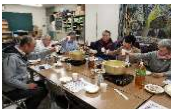
鍋を囲んで、ささやかながら和気あいあいと(4F会議室)