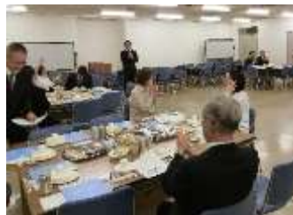
各フロアのテナント(学校用品・学校生協・弘済会・佐教組・高教組・教職員共済など)が一堂に会した(1F会議室)