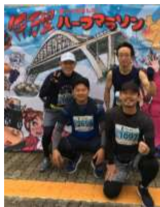
伊万里 ハーフマラソン 2020年1月13日(祝) 参加3837名(全部門合計)

2020年の走り初め、有田の皆さんと 一緒に走りました。コースの伊万里湾大橋 はとてもいい景色です。先に行くナイキの 厚底シューズの人を抜き去ってドヤ顔にな ってたかなあ。ペースは一定に、予想に近 い1時間27分でゴール。大会運営に携わら れた高校生や先生方、スタッフの皆さんに 感謝です。