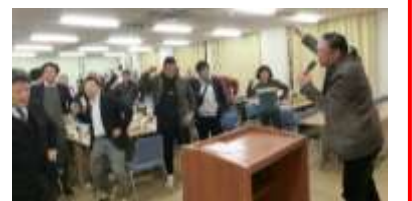
締めは「団結ガンバロー!」

各団体より、今年とくに力を入れた活動について決意表明がありました。高教組からは、「変形時間労働制の条例化反対」への理解と協力を呼びかけました。