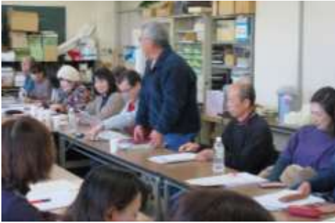
中四九ブロック各県から9名、佐賀21名の合計30名が参加(於 高教組会議室)