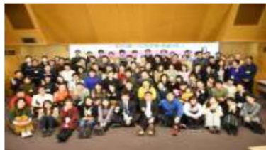
全国の青年教職員が集結！