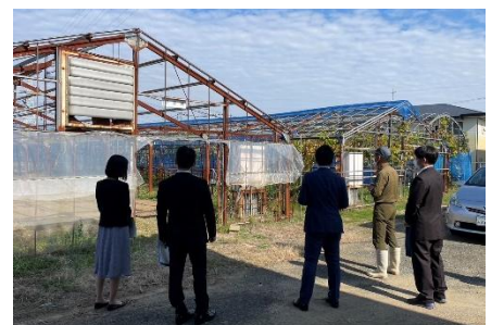
神埼清明高校にて

議会では学校管理運営費について光熱費等の上昇を踏まえ、予算の拡充が決定しました。その他、「今後の価格高騰の影響についても適宜対応していく」と答弁がありました。