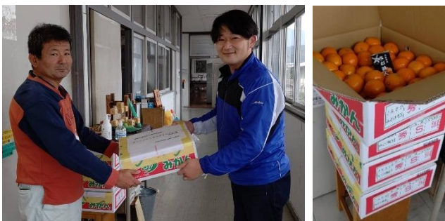
11月17日(木)松本分会長「みかんは佐賀美人だよ〜」

伊万里実業農林キャンパス分会へ、みかん贈呈 全教共済【総合・生命・医療・おうち】新規加入3名を達成すると、3名ごとに1万円相当のギフトを贈呈します！ 次は大和特別支援分会へ行きます！