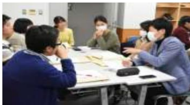
なんでも聞けます話せます分科会