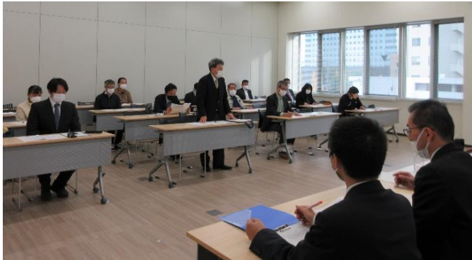
交渉に臨む執行部と組員 佐賀市町会館にて

12月5日(月)、秋季要求交渉の3回目を行い、13名が参加しました。交渉には教育委員会の各課から担当者が対応し、高教組の重点要求について回答を行いました。