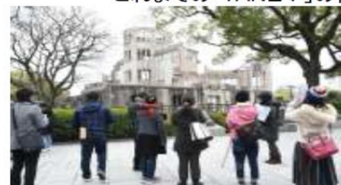
社会と教育をつなぐ講座も