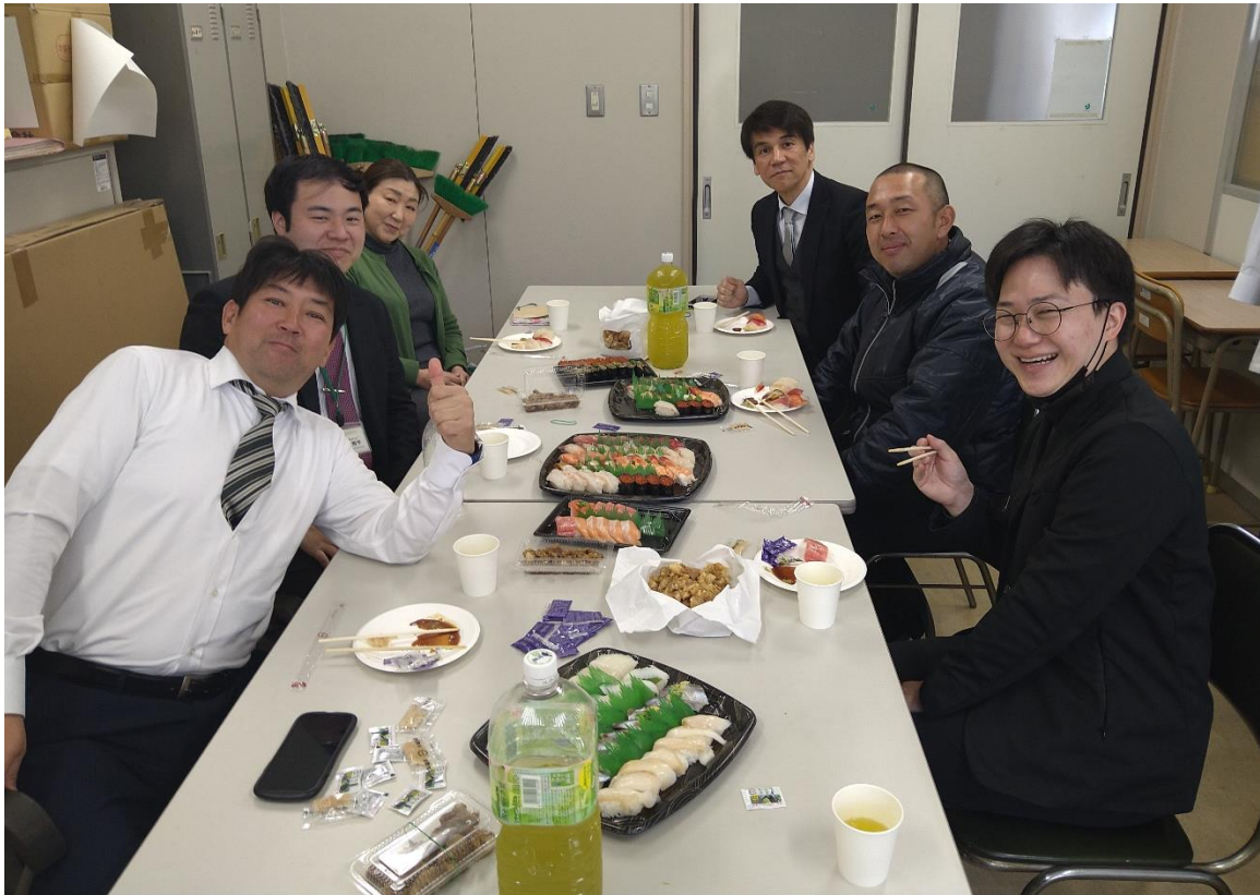
鳥栖商業高校分会の職場懇親会